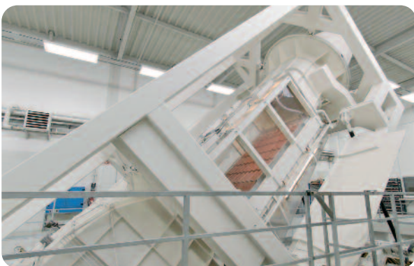
Regen- und Sturmsicherheit im Windkanal unter den härtesten Bedingungen getestet und bewiesen.

In Verbindung mit der speziellen Unterkonstruktion bilden die Module eine langlebige, regensichere Dacheindeckung. Spezielle Lüftungsschlitze in der Unterkonstruktion sorgen für eine gute Hinterlüftung, die vor zu starker Erwärmung und daraus resultierenden Leistungsverlusten schützen.